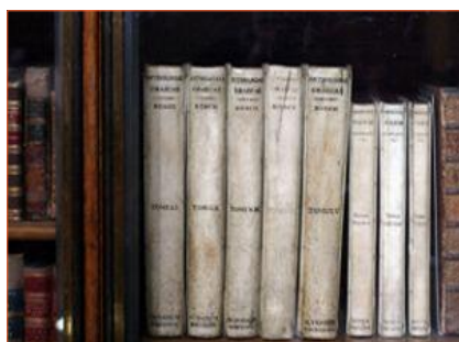
Antología Palatina, British Museum de Londres

En la Antología Palatina o Antología Griega, del siglo V, se recogen más de 40 problemas de ese tipo.