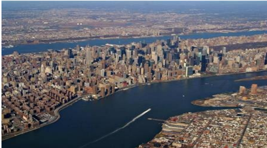
La ciudad de Nueva York

La ciudad es un lugar con edificios y mucha gente.