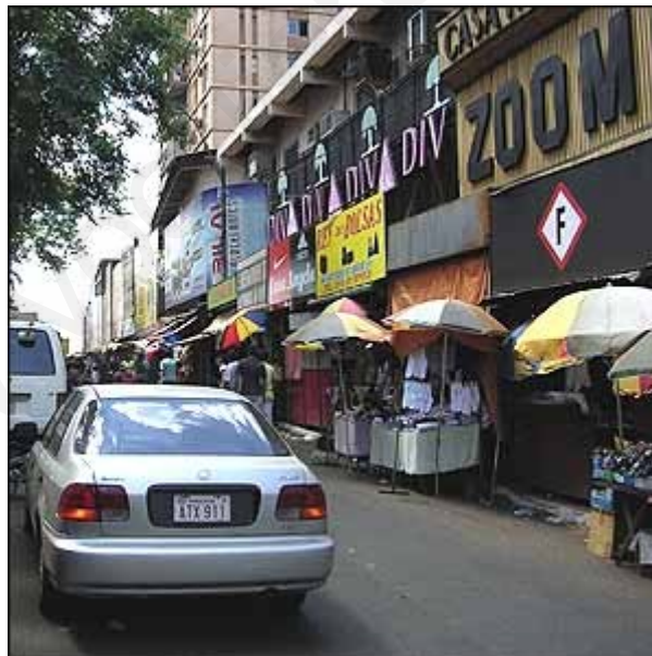
Comercios en una ciudad