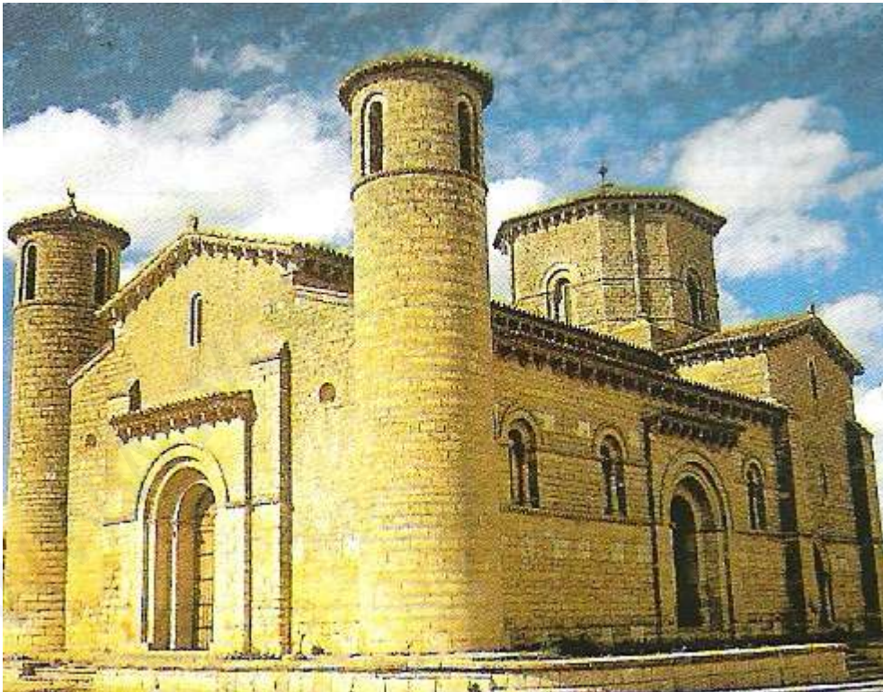
San Martín de Fromista (Palencia)