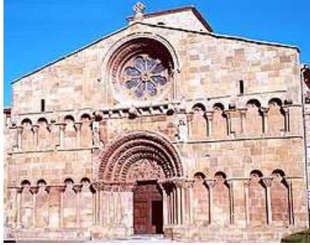
Santo Domingo de Soria