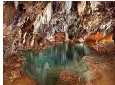
Gruta de las Maravillas