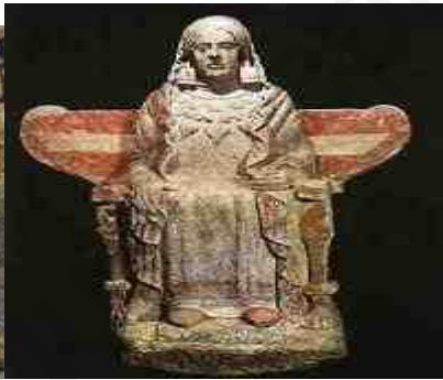
Dama de Baza