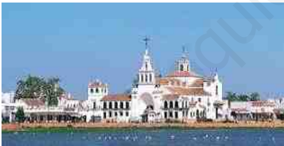
Ermita del Rocío