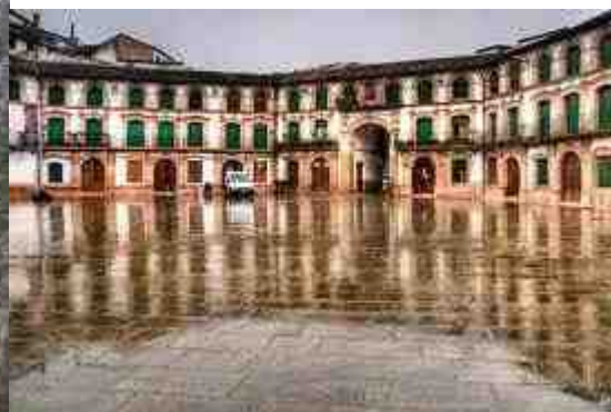
Plaza Ochavada (Archidona)