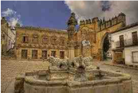
Almazaras de Jaén