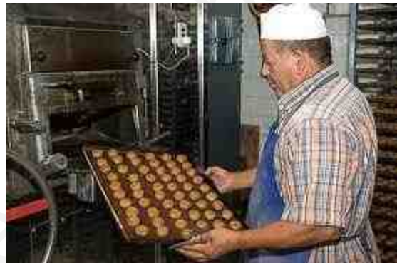
Mostachones de Utrera