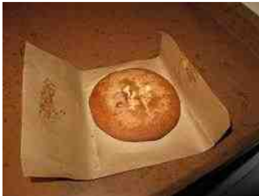
Virgen de la Cabeza (Andújar)