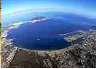
Bahía de Algeciras.