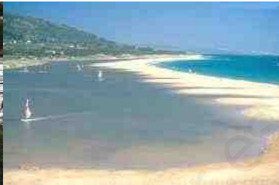
Sanlúcar de Barrameda.