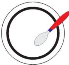
plato صحن sáhn