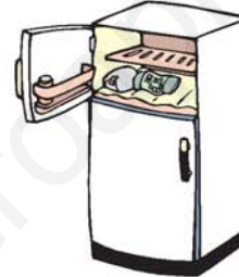
frigorífico براد - ثلاجة zál-lácha, barrád