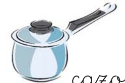
cazo طنجرة tánchara