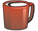
taza فنجان finchán