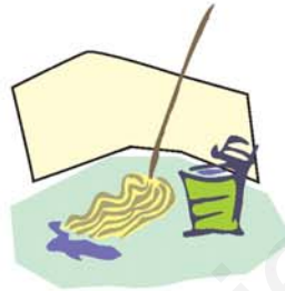
fregona جفافة chifáfa