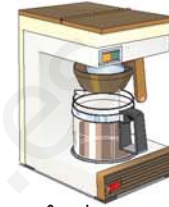
cafetera كافيتيرا kafitíra