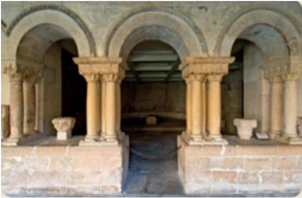
Arco de medio punto (románico)

Los arcos. Cubren un espacio entre dos paredes o columnas.