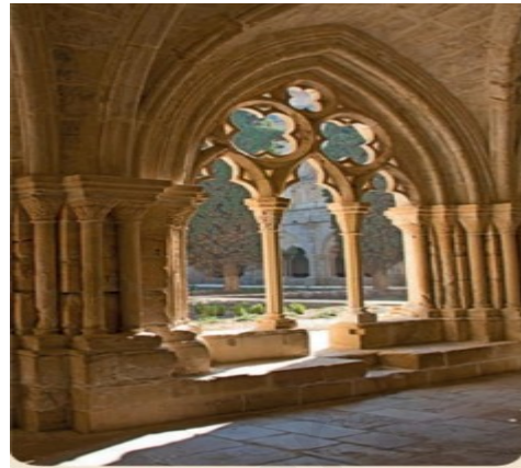
Arco ojival o apuntado. (gótico)

Las columnas. Aguantan el peso de los edificios. Tienen 3 partes: basa (A) , fuste (B) y capitel ( C)