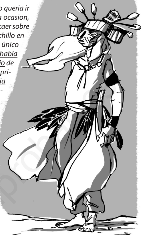
Jordi SIERRA I FABRA El último verano miwok, SM

El día en que Tortuga Veloz observó mis manos fue el último día que vimos a nuestro amigo como siempre le habíamos visto. Por eso guardo un recuerdo muy especial de él. Ya nada sería igual a partir de ese día, y los ciegos impulsos de la naturaleza humana desencadenarían la tempestad a la que nos vimos arrojados. Cuando Susan y yo regresábamos a casa, estuvimos comentando lo que no nos atrevimos a expresar en la cabaña: el aspecto de Tortuga Veloz. Como papá, él también, a veces, parecía envejecer súbitamente. Fuesen cuales fuesen los sueños de la noche anterior, tuvieron que ser muy especiales y de muy difícil interpretación, a pesar de sus mágicos poderes de hechicero miwok.