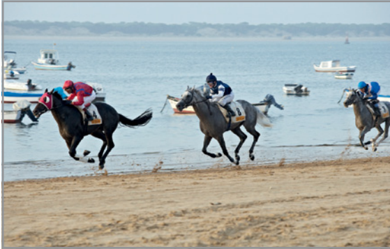
► Carrera de caballos en Sanlúcar de Barrameda.

1 Elabora una noticia a partir de esta fotografía: