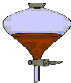
Figura. Embudo de decantación

Se utiliza para separar dos líquidos con diferente densidad como por ejemplo agua y aceite. Se utiliza un instrumento conocido como embudo de decantación como el de la figura.