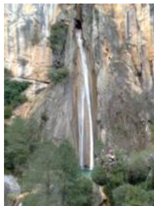
Nacimiento del Guadalquivir (Cazorla)