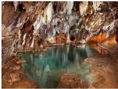
Gruta de las Maravillas