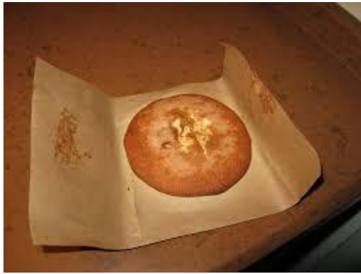
Mostachones de Utrera