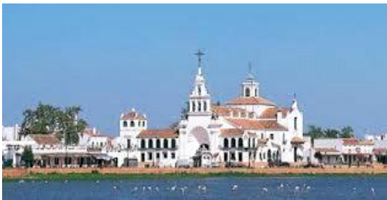
Ermita del Rocío