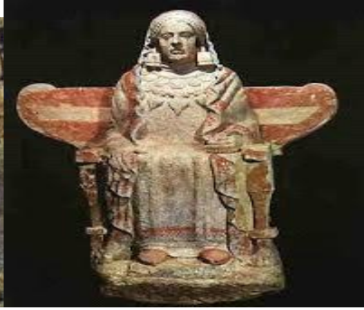
Dama de Baza