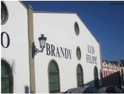
La Palma del Condado