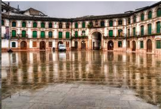
Plaza Ochavada (Archidona)