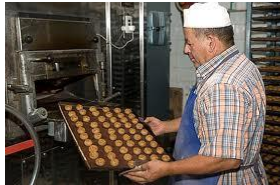
Mantecados de Estepa