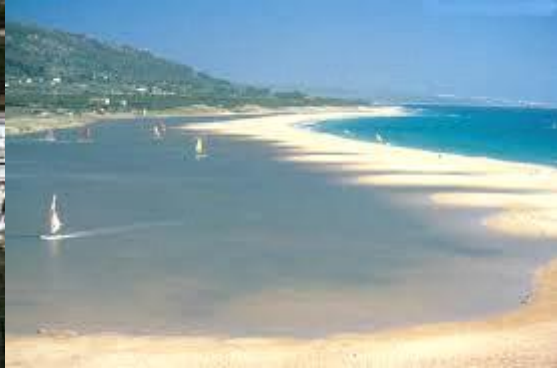
Sanlúcar de Barrameda.