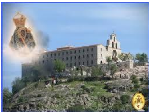
Virgen de la Cabeza (Andújar)