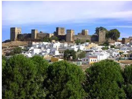
Alcalá de Guadaíra