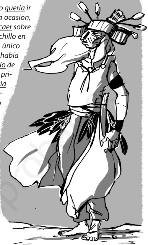
Jordi SIERRA I FABRA El último verano miwok, SM

El día en que Tortuga Veloz observó mis manos fue el último día que vimos a nuestro amigo como siempre le habíamos visto. Por eso guardo un recuerdo muy especial de él. Ya nada sería igual a partir de ese día, y los ciegos impulsos de la naturaleza humana desencadenarían la tempestad a la que nos vimos arrojados. Cuando Susan y yo regresábamos a casa, estuvimos comentando lo que no nos atrevimos a expresar en la cabaña: el aspecto de Tortuga Veloz. Como papá, él también, a veces, parecía envejecer súbitamente. Fuesen cuales fuesen los sueños de la noche anterior, tuvieron que ser muy especiales y de muy difícil interpretación, a pesar de sus mágicos poderes de hechicero miwok.