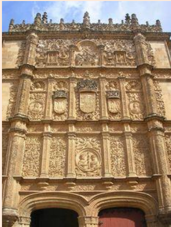
FACHADA UNIVERSIDAD SALAMANCA