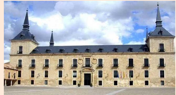
PALACIO DUCAL DE LERMA