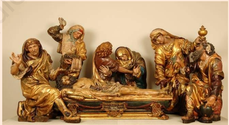
EL ENTIERRO DE CRISTO (Juan de Juni)