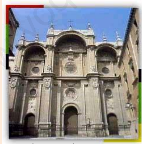
CATEDRAL DE GRANADA