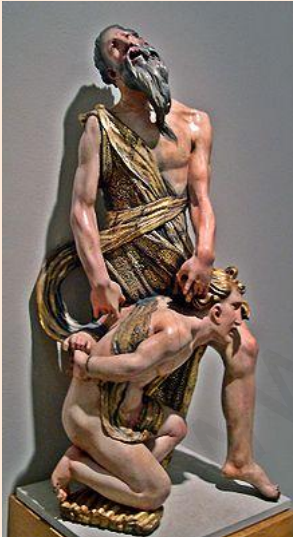
EL SACRIFICIO DE ISAAC (Alonso de Berruguete)