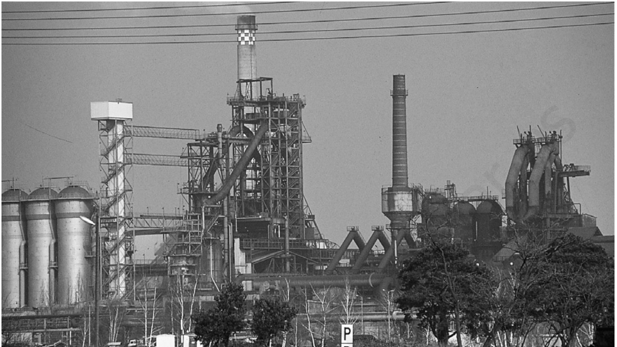
Industria siderúrgica Eko Stahl AG (Alemania).

1 Analizar una fotografía. Observa atentamente la imagen y responde ahora a las siguientes preguntas: