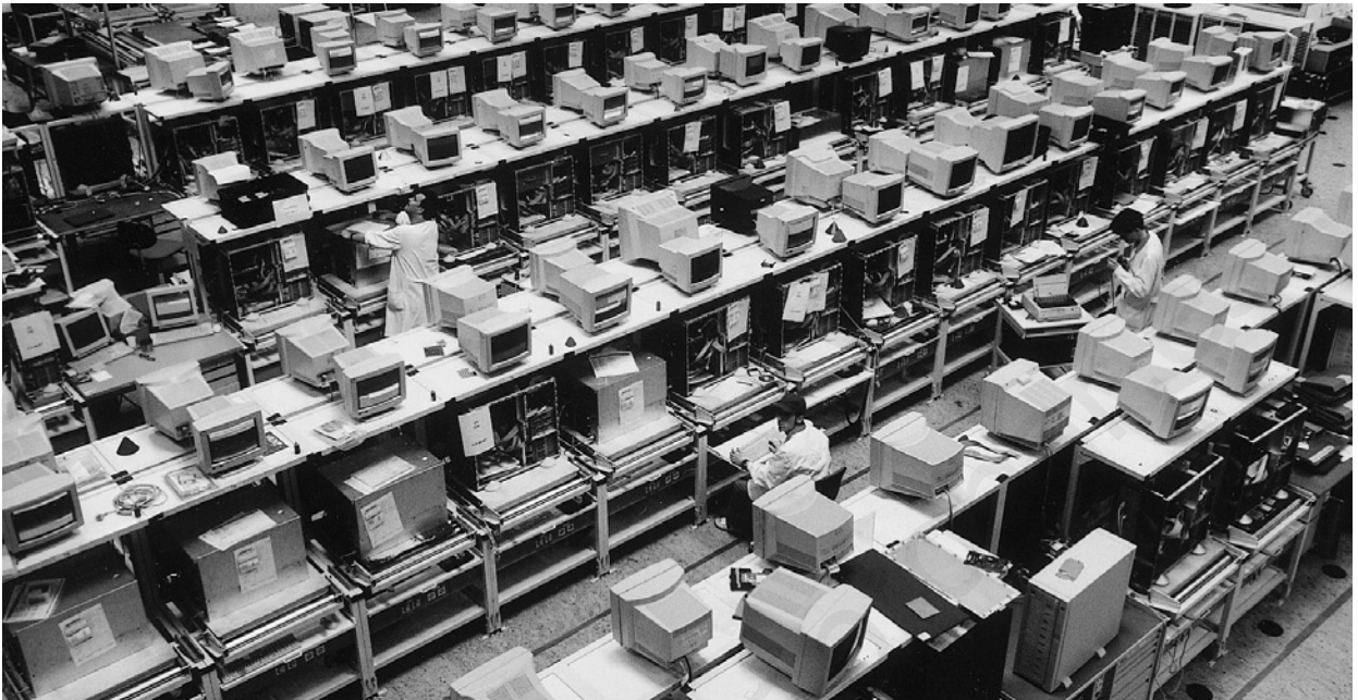
Departamento de prueba de ordenadores de la fábrica Siemens-Nixdorf, donde fabrican 5.500 ordenadores diariamente y trabajan 2.290 personas.