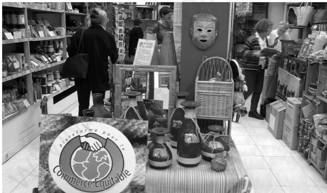
Tienda de comercio justo.