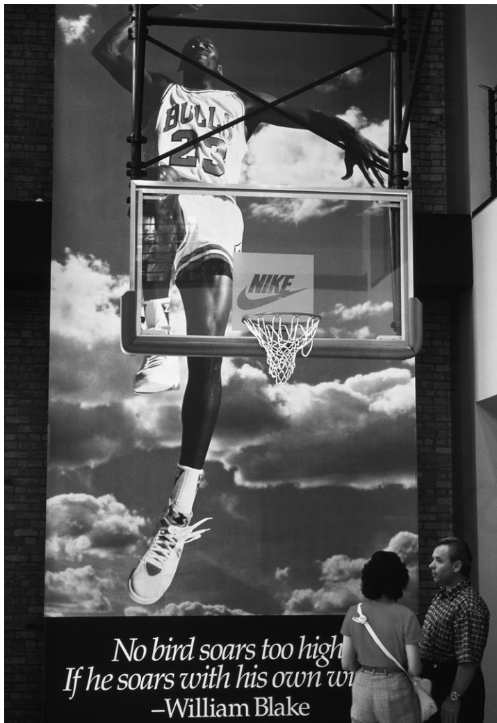
Anuncio de la marca Nike.

Para promocionar sus productos, las empresas, entre ellas las multinacionales, utilizan diversas estrategias publicitarias. Uno de sus objetivos es que el producto se identifique fácilmente en cualquier lugar del mundo; para ello, utilizan un código «oculto» de colores y líneas con el que transmiten determinados mensajes, que, a fuerza de ser repetidos, son asimilados de forma inconsciente por los receptores del anuncio.