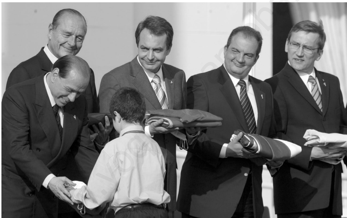
Líderes de la UE recibiendo las banderas de sus países.

ELPAIS.com, febrero de 2007 (Adaptación)