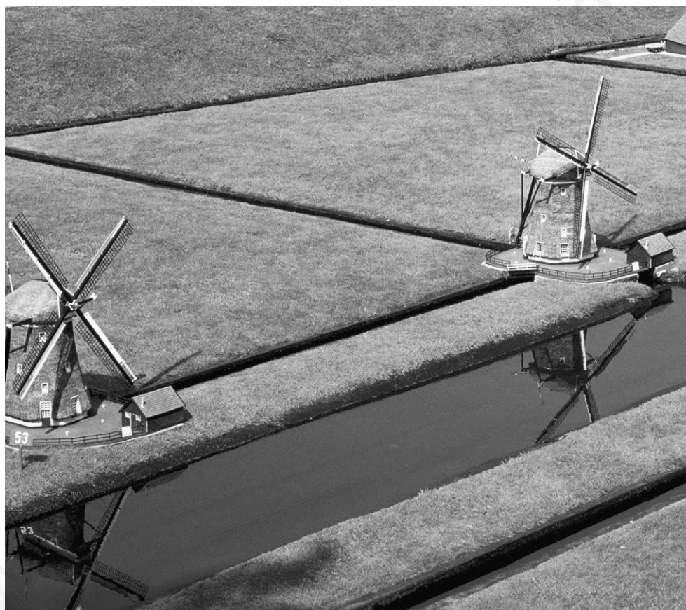
Polders en los Países Bajos.

R. MÉNDEZ y F. MOLINERO Espacios y sociedades Ariel (Adaptación)