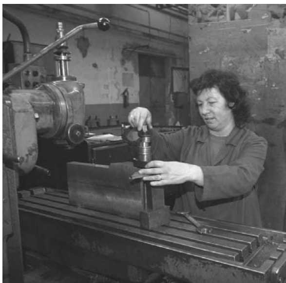
Industria en Serbia.

En los países europeos orientales la industria ha sido sometida a un proceso de _____ para superar su atraso _____ y hacerla más productiva y _____.