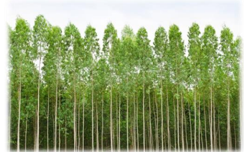
Bosques de eucaliptos