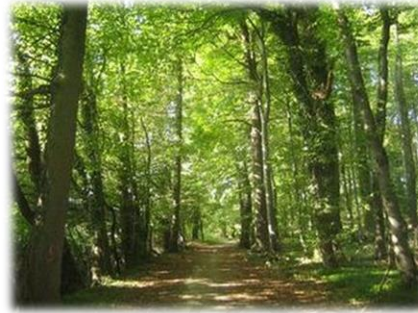
Bosques de frondosas (roble, haya, encina)