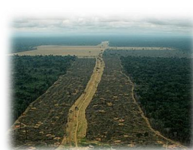
Cultivos en selva