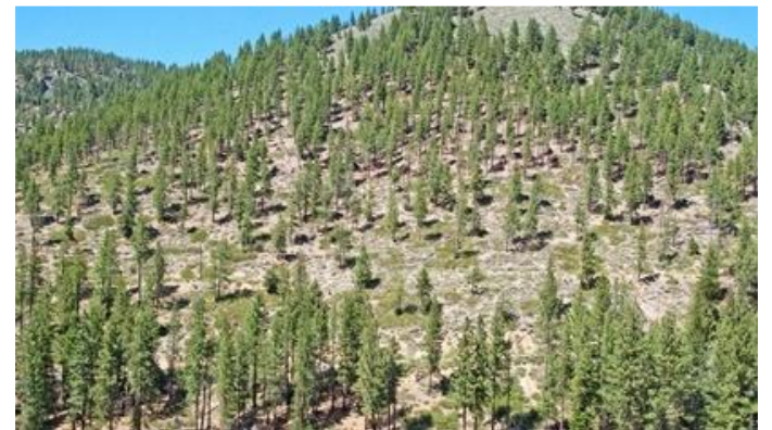
Planes de Reforestación y protección de espacios naturales ( pinares)