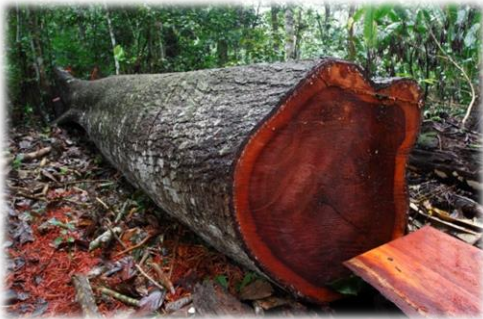
Maderas preciosas del bosque tropical (caoba, ébano, teca...)