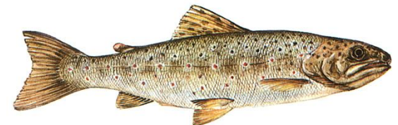
Trucha (peces de agua dulce)