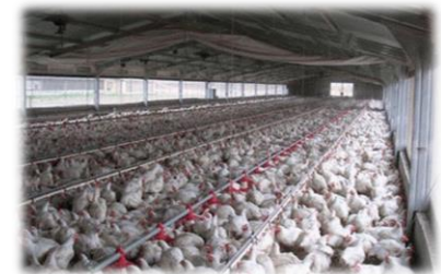
Ganadería intensiva o estabulada