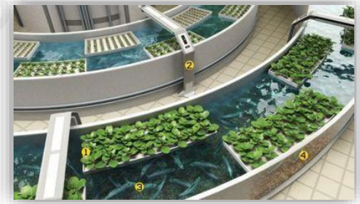
Acuaponia (cultivo de algas)

Ventajas principales: alta producción y variada, sin restricciones (sin cuotas pesqueras impuestas por la PPC de la UE), no agota caladeros y de precios asequibles.