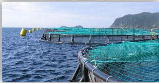
Acuicultura agua salada

Cría de especies acuáticas en granjas marinas y piscifactorías, con agua dulce o agua de mar.