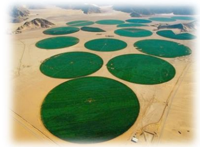
Agricultura en el desierto