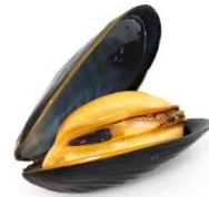
Mejillón, almeja y ostra (crustáceos)