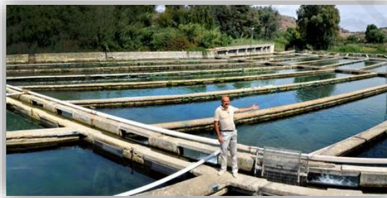
Acuicultura agua dulce