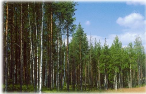
Bosques de coníferas (abetos, pinos, cedros)