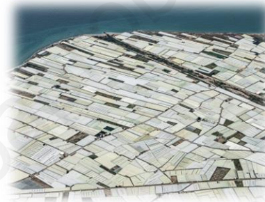
Mar de plástico (Invernaderos)