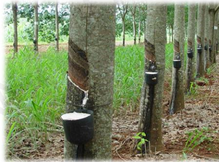
Caucho natural (Hevea, árbol del Amazonas)